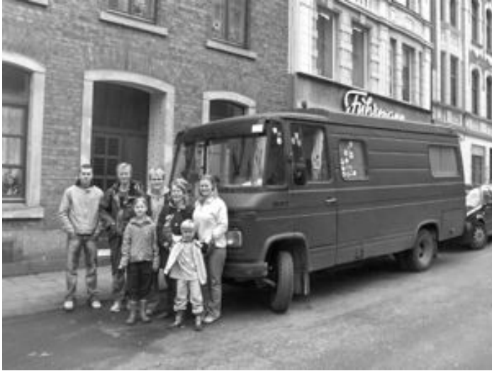
Perheelle tärkeä asuntoauto ("Assari") viimeisellä matkallaan v. 2008. Auto lahjoitettiin Malagaan, josta se aikanaan salakuljetetaan Marokkoon.