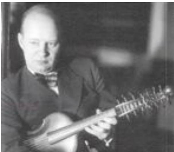
Paul Hindemith viola d'amorensa kanssa